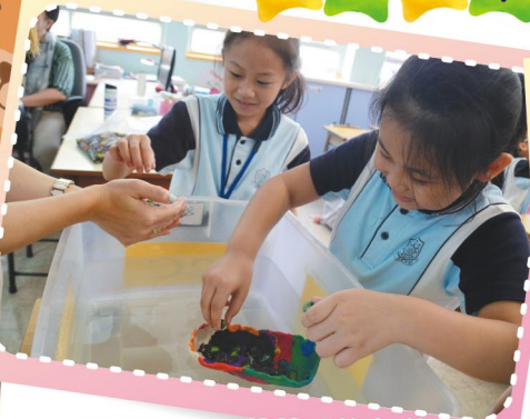
同學們小心翼翼地放上棋子