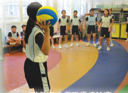
刺激的班際閃避球比賽

「日日運動真體好，男女老幼做得到」體育科舉行健康活動日，透過各項活動宣傳運動的重要性，同學們都非常投入活動當中。