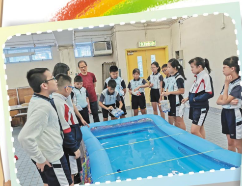
終於等到緊張的爆船測試時刻