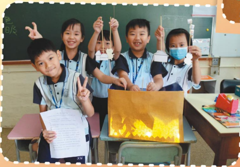
我們齊心合力完成「影子」作品