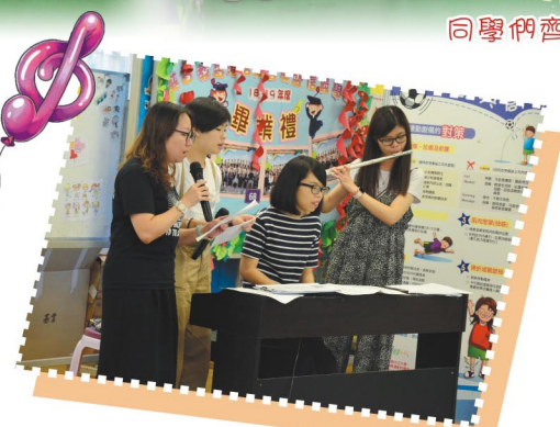
老師們一起彈鋼琴唱唱歌