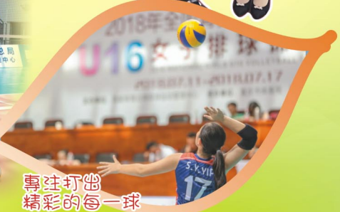
專注打出精彩的每一球