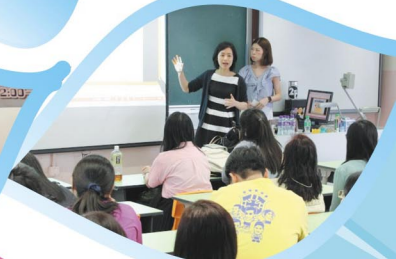
黃老師和司徒老師分享如何透過班級經營推行正向教育