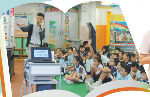
我們都喜愛問答比賽