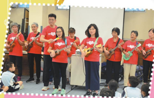
老師們精彩的演出