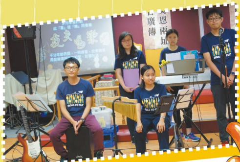
「友共鳴樂團」的演出真精彩

為了讓學生接觸多元化的音樂知識，擴闊視野，並培養學生評賞音樂及審美的能力，學校舉行一年一度的音樂日，活動內容非常豐富，如蔡信Got Talents和「樂」在蔡信展潛能Show，學生盡展潛能，顯出能歌善舞的一面。在蔡信Got Talents中更有老師們精彩的演出，令現場氣氛相當熱鬧。除了學生表演環節外，低年級學生更有機會演奏小結他，高年級學生欣賞精彩的「友共鳴樂團」音樂交流。