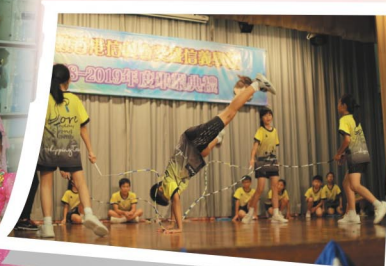
花式跳繩隊祝畢業生充滿活力迎接中學生活