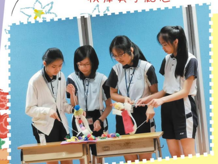
親親木偶「身」體驗藝術活動