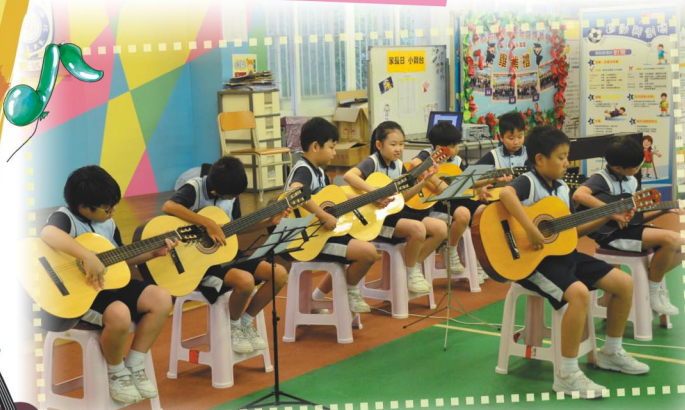
結他隊彈奏動聽樂曲