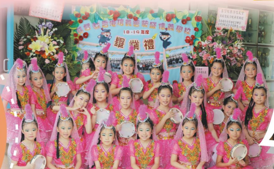
中國舞初小組祝哥哥姐姐畢業快樂