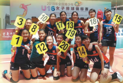
倩儀和隊員們參加排球錦標賽