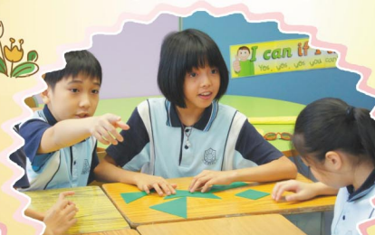
你一塊我一塊，難題解開了。