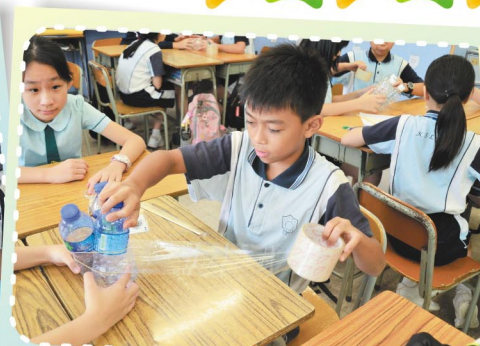
齊心合力製作爆船