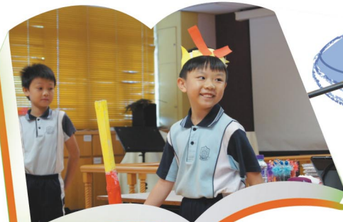
我是齊天大聖孫悟空