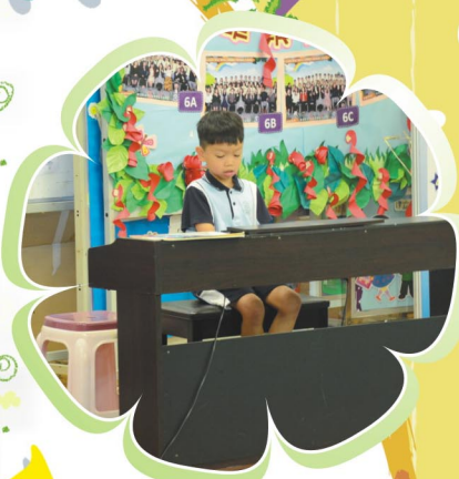
一年級學生演奏鋼琴