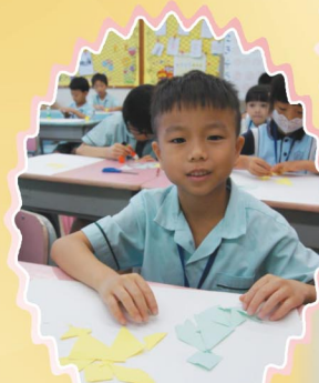
我運用平面圖形發揮創意，拼出可愛的小動物。

「數普日」當天，學生運用了熟練的普通話進行了各項活動，例如攤位遊戲、問答比賽、量度估算活動……大家都積極參與各項活動，充滿樂趣！