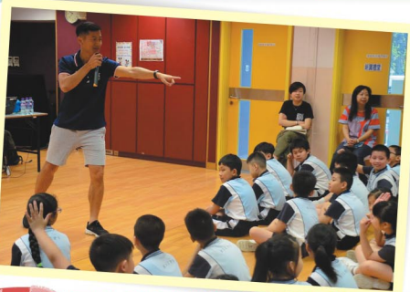
運動員為同學講解運動的知識