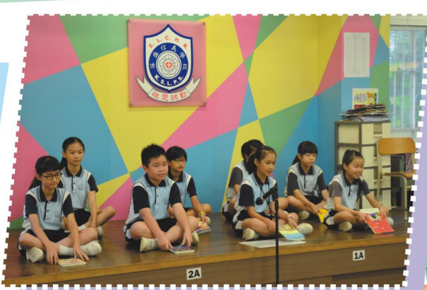
環保敲擊樂隊有趣的演出