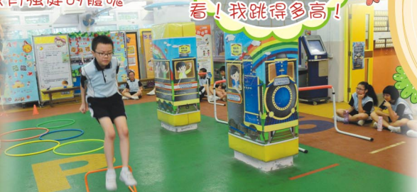
看我靈活的身手跨越障礙物