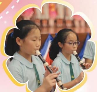
祝哥哥姐姐能譜出精彩的人生