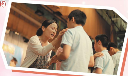
嚴肅而感人的祝福禮