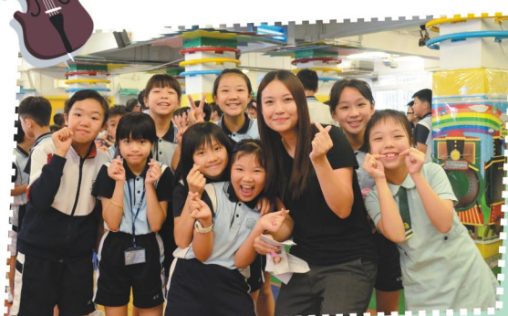
老師的歌聲真動聽