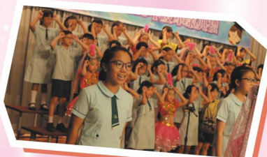
讓我們合唱團為大家高歌一曲