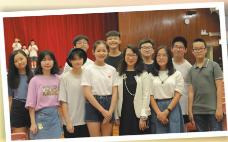
校友們一同參與畢業典禮

本校致力維繫同窗情誼，促進校友間之友誼及合作，定期舉辦活動以凝聚校友力量，並邀請校友協助母校推廣教育工作，能夠鼓勵在校同學在品德及學業兩方面更有長進。