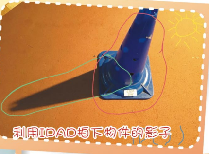
利用IDAD拍下物件的影子

本年度的科探日配合STEM教育。學生可以透過動手做實驗及進行各項活動，培養他們對科學的興趣，增加他們的科學知識。