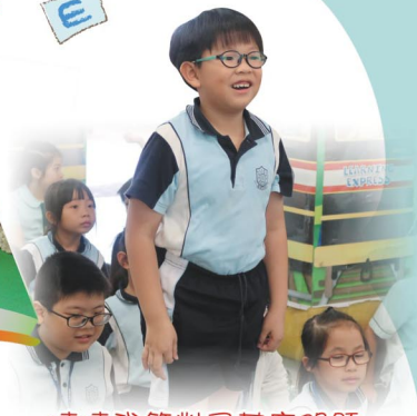
猜猜我答對了甚麼問題