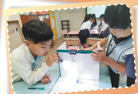
我們利用小工具找出影子的成因