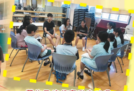
舊生回校分享升中心得