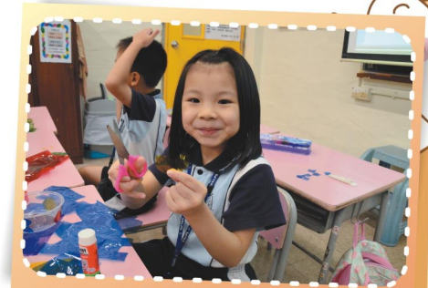
猜猜我在製作甚麼？