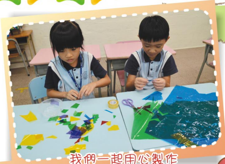
我們一起用心製作色彩繽紛的萬花筒