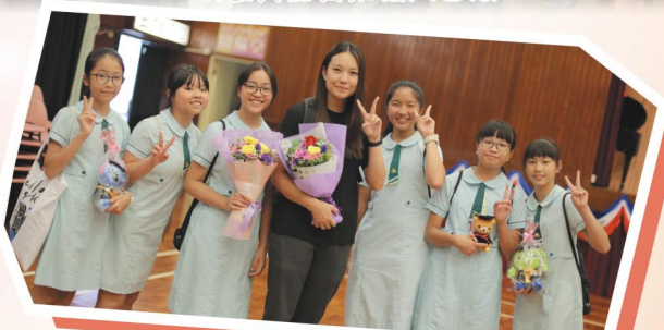
感謝老師悉心的教導