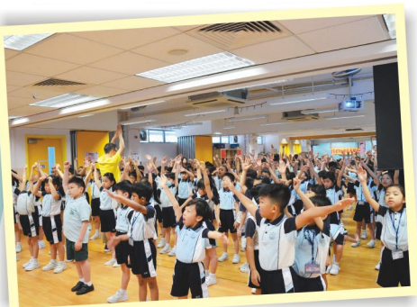
一起伸伸手，扭扭腰