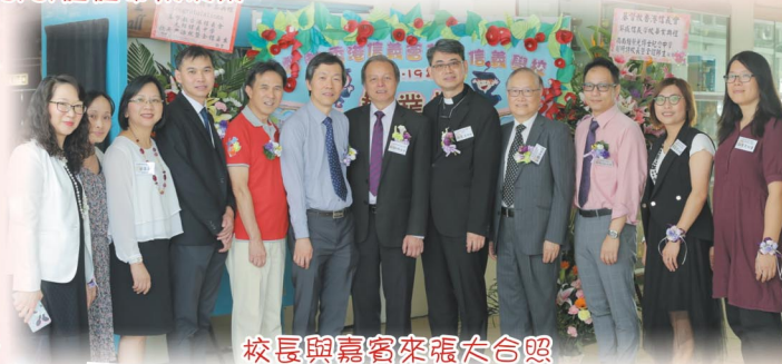
校長與嘉賓來張大合照