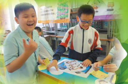
攤位遊戲難不倒我