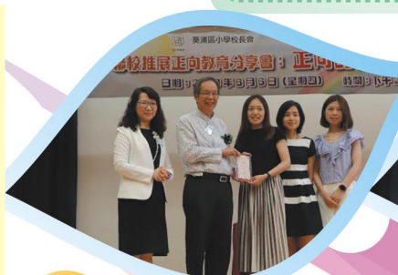
老師獲頒發感謝狀

本校透過教育局的安排，向其他學校老師介紹本校推行正向教育的其他學科，其介紹向是反校予