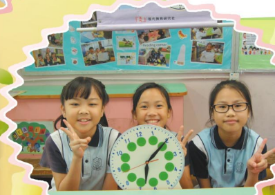
攤位遊戲大使真精靈