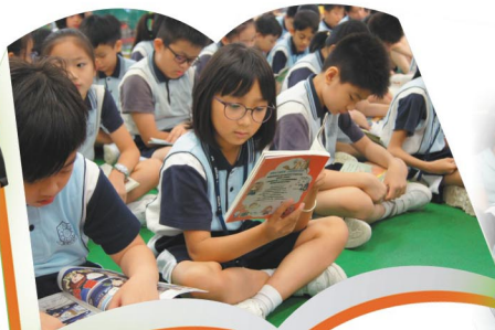
師生一起專心閱讀圖書