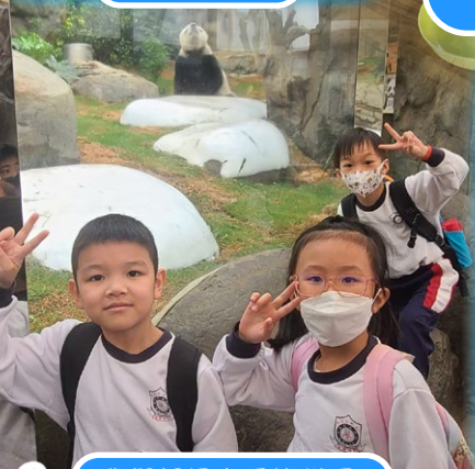
我們都很喜愛熊貓呢！