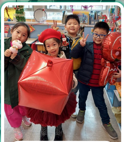
充滿節日氣氛的聖誕會