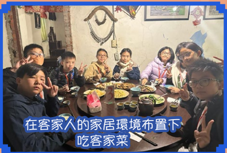
在客家人的家居環境布置下吃客家菜