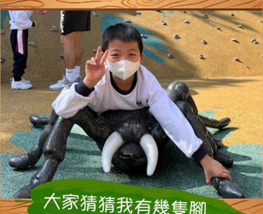
大家猜猜我有幾隻腳