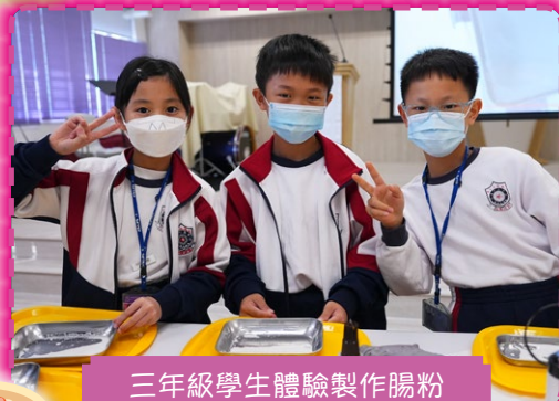
三年級學生體驗製作腸粉