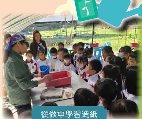
從做中學學習造紙