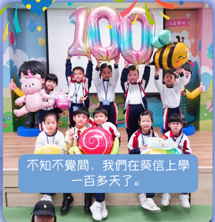
不知不覺間，我們在葵信上學 一百多天了。