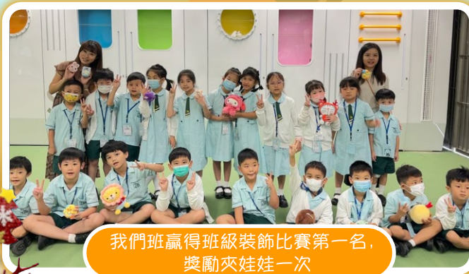
我們班贏得班級裝飾比賽第一名，獎勵夾娃娃一次