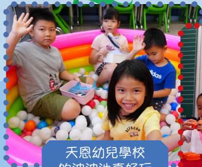
天恩幼兒學校 的波波池真好玩