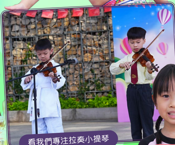
看我們專注拉奏小提琴