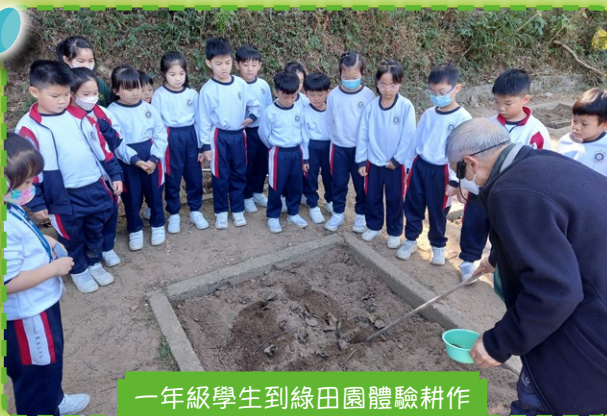
一年級學生到綠田園體驗耕作