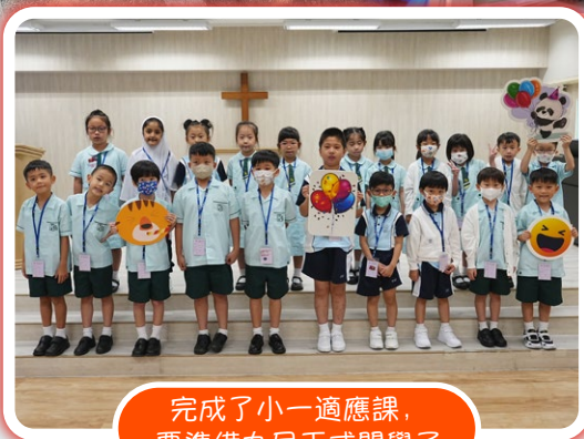
完成了小一適應課，要準備九月正式開學了