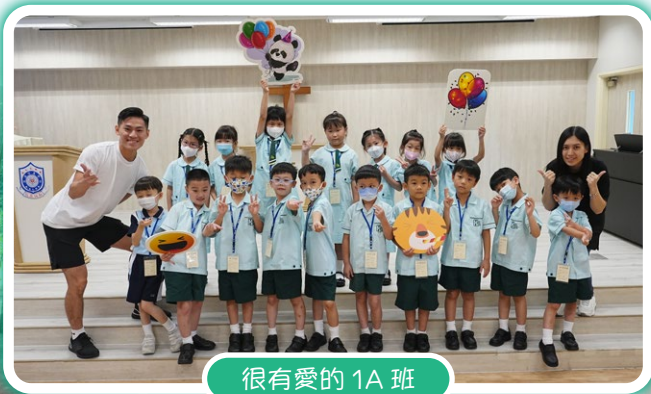
很有愛的 1A 班