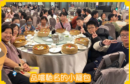
品嚐馳名的小籠包