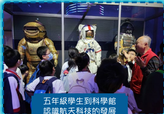
五年級學生到科學館 認識航天科技的發展