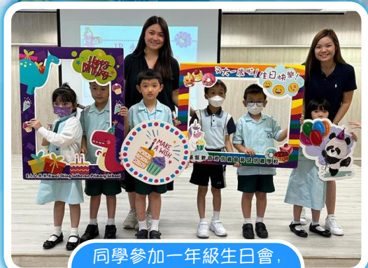
同學參加一年級生日會， 真開心！