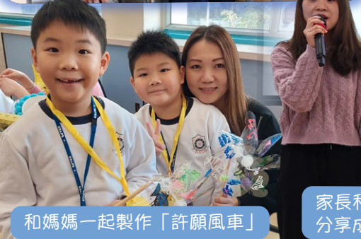
和媽媽一起製作「許願風車」