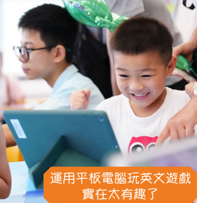
運用平板電腦玩英文遊戲 實在太有趣了