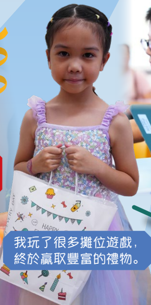
我玩了很多攤位遊戲， 終於贏取豐富的禮物。