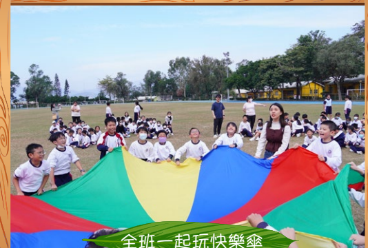
全班一起玩快樂傘