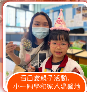
百日宴親子活動，小一同學和家人溫馨地做風車手工