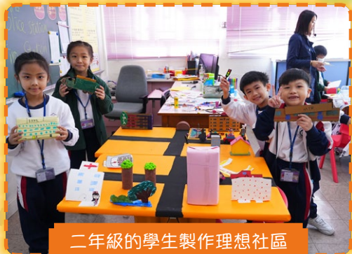
二年級的學生製作理想社區