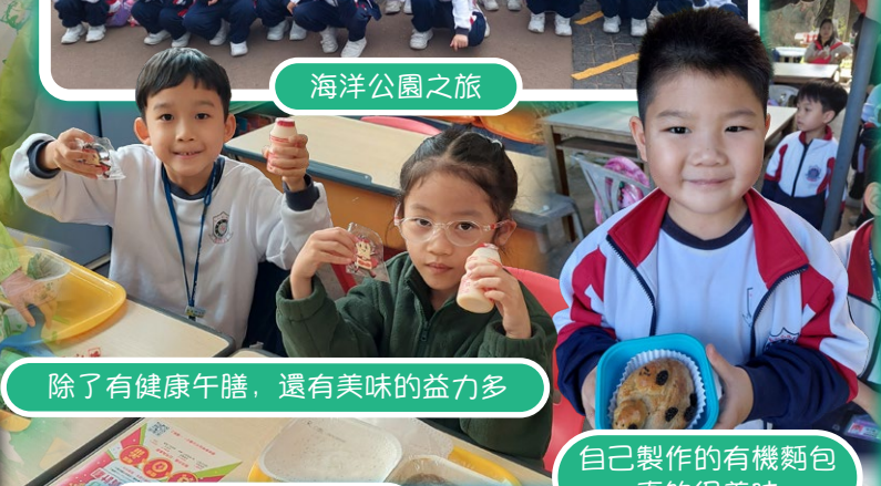
除了有健康午餐，還有美味的益力多