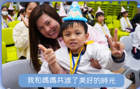
我和媽媽共渡了美好的時光