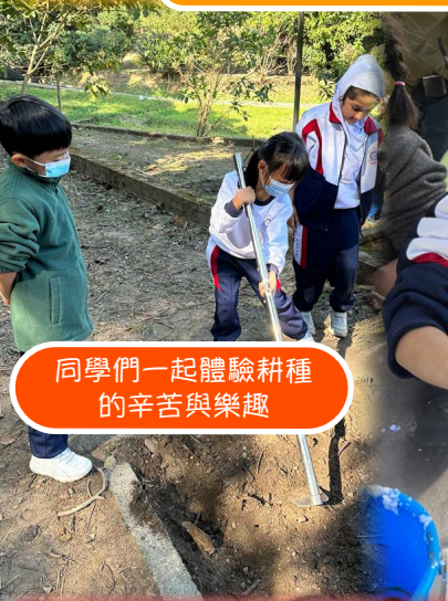
同學們一起體驗耕種的辛苦與樂趣