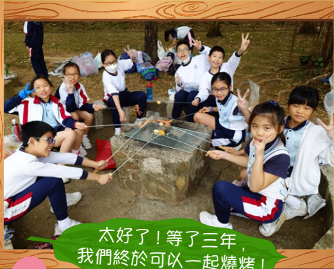
太好了! 等了三年, 我們終於可以一起燒烤!