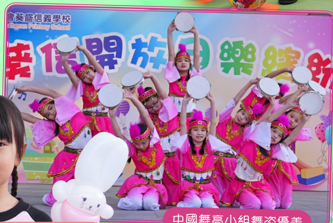
中國舞高小組舞姿優美