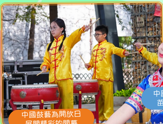
中國鼓藝為開放日 展開精彩的開幕