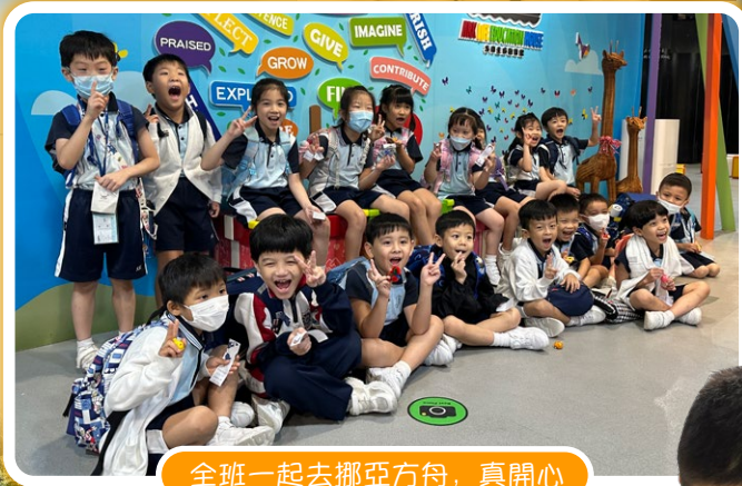
全班一起去挪亞方舟，真開心