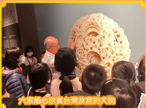
大家細心欣賞台灣故宮的文物