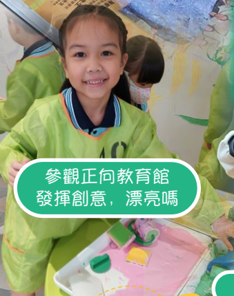
參觀正向教育館 發揮創意，漂亮嗎