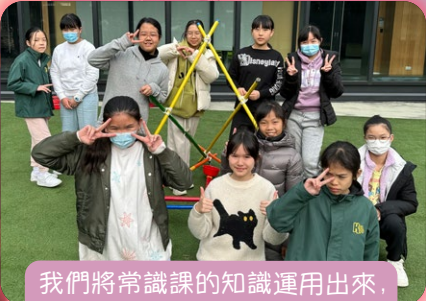
我們將常識課的知識運用出來， 製成羅馬炮架！