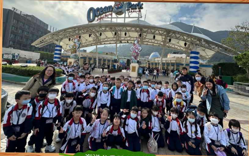
海洋公園門口大合照