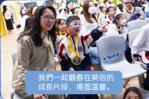
我們一起觀看在葵信的 成長片段，場面溫馨。