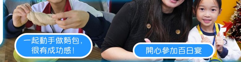
一起動手做麵包， 很有成功感！