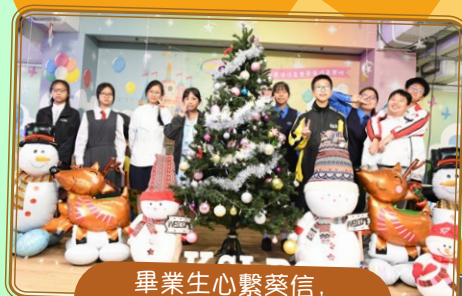
畢業生心繫葵信， 回校協助攤位遊戲。