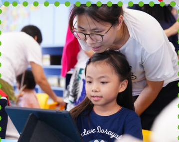
媽媽和我一起完成任務