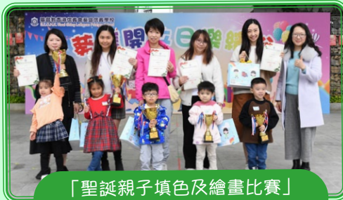
「聖誕親子填色及繪畫比賽」 幼稚園組別得獎者