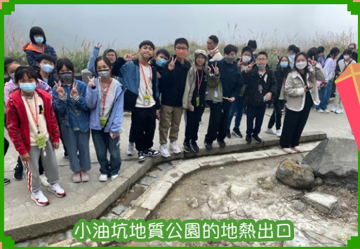
小油坑地質公園的地熱出口