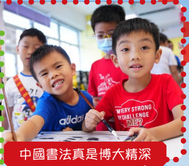
中國書法真是博大精深