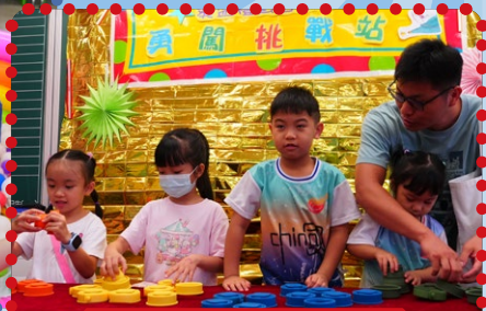
葵盛禮賢會幼稚園的攤位 遊戲很受歡迎呢！