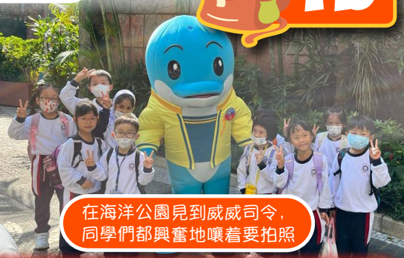
在海洋公園見到威威司令，同學們都興奮地嚷着要拍照