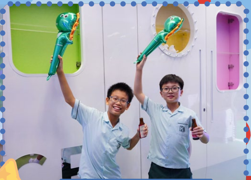
服務生積極協助攤位遊戲