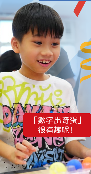
「數字出奇蛋」 很有趣呢！