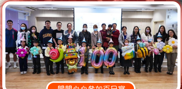
開開心心參加百日宴