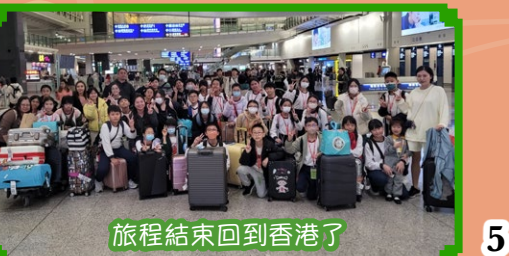
旅程結束回到香港了