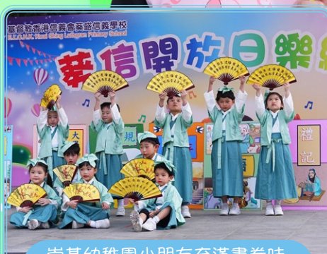
崇基幼稚園小朋友充滿書卷味， 跳起舞來亦十分活潑可愛！