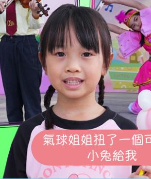
氣球姐姐扭了一個可愛 的小兔給我