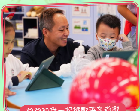
爸爸和我一起挑戰英文遊戲