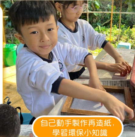
自己動手製作再造紙，學習環保小知識