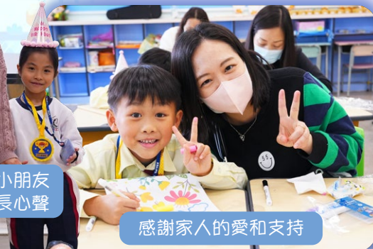
家長和小朋友 分享成長心聲