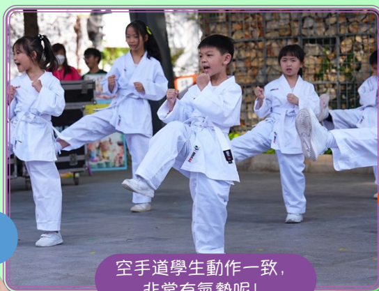
空手道學生動作一致， 非常有氣勢呢！