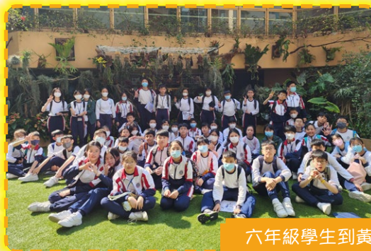
六年級學生到黃金海岸親親大自然