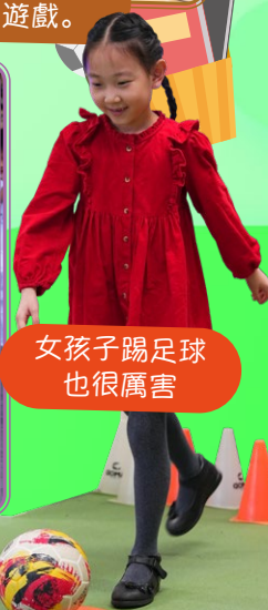
女孩子踢足球 也很厲害