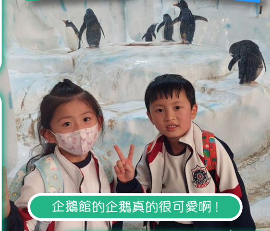
企鵝館的企鵝真的很可愛啊！