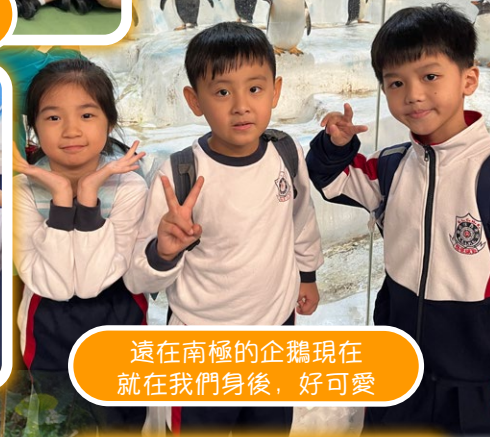
遠在南極的企鵝現在就在我們身後，好可愛