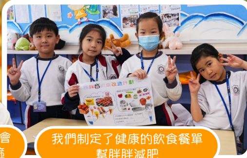
我們制定了健康的飲食餐單 幫胖胖減肥