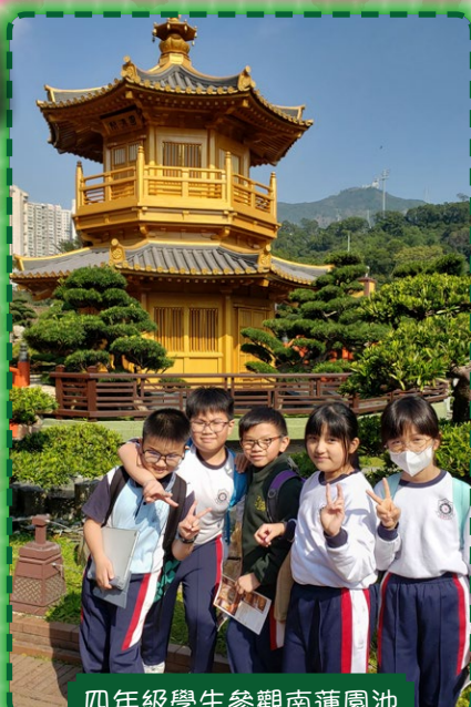
四年級學生參觀南蓮園池