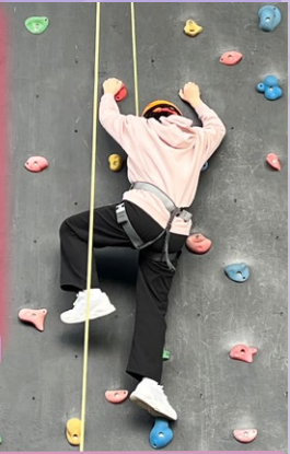
你能從我的背影中看到 我堅毅的精神嗎？