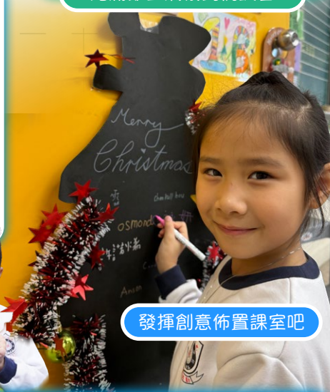
發揮創意佈置課室吧