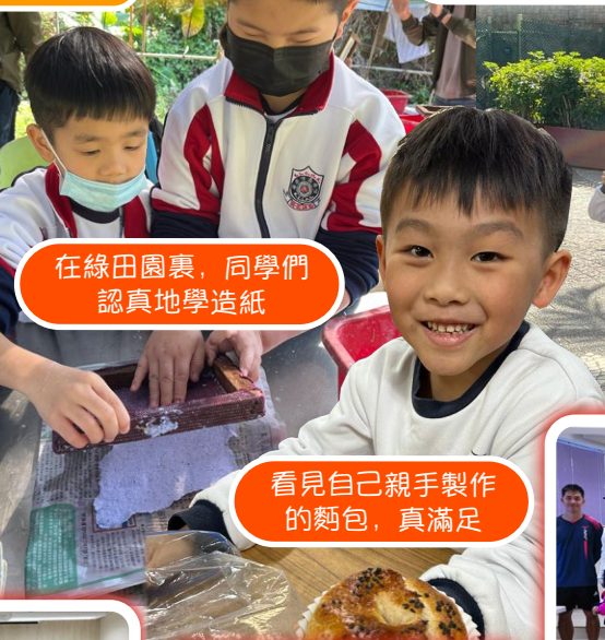
在綠田園裏，同學們認真地學造紙