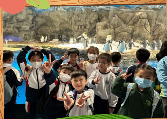
我們和企鵝一樣可愛, Yeah