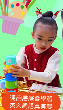
運用層層疊學習 英文詞語真有趣