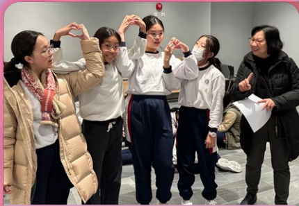
學生投入地參與教會福音分享遊戲