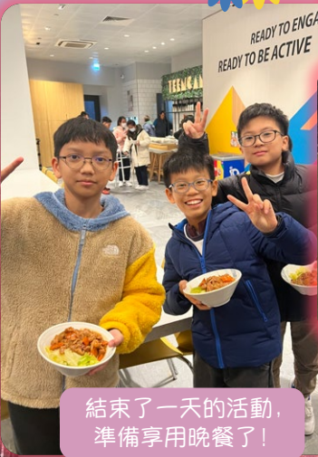
結束了一天的活動， 準備享用晚餐了！