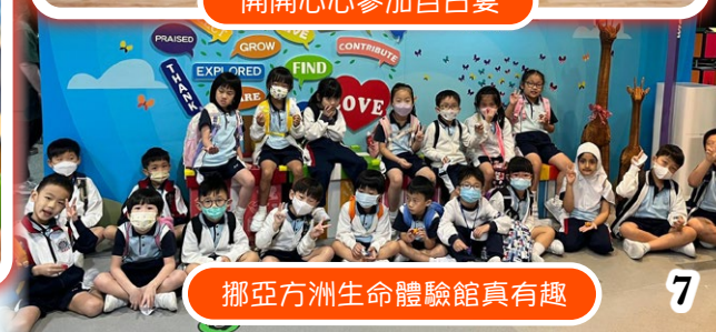
挪亞方舟生命體驗館真有趣