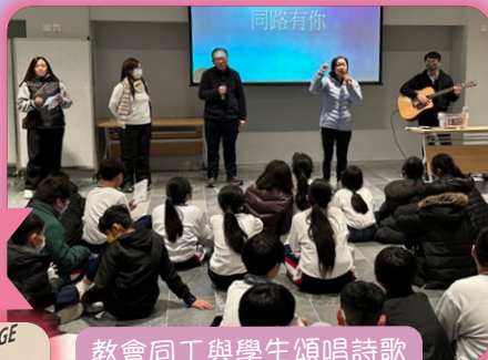
教會同工與學生頌唱詩歌