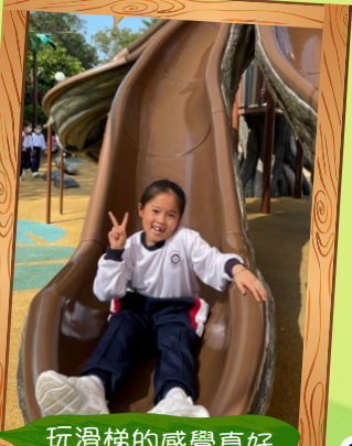
玩滑梯的感覺真好