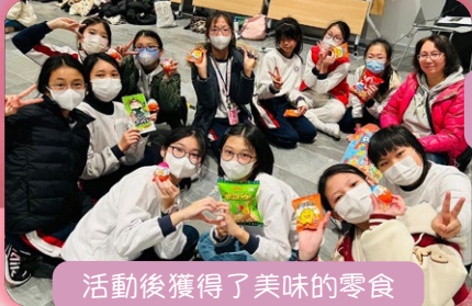
活動後獲得了美味的零食