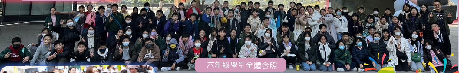
六年級學生全體合照