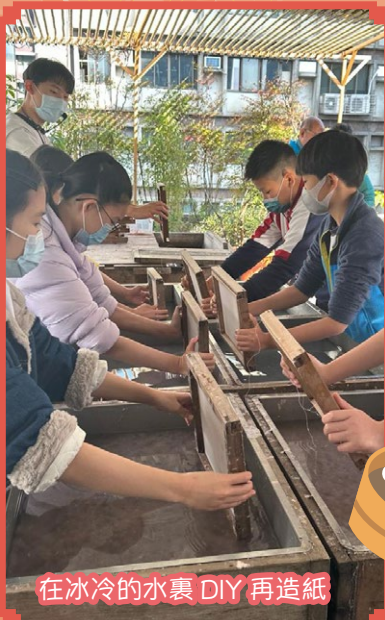
在冰冷的水裏 DIY 再造紙