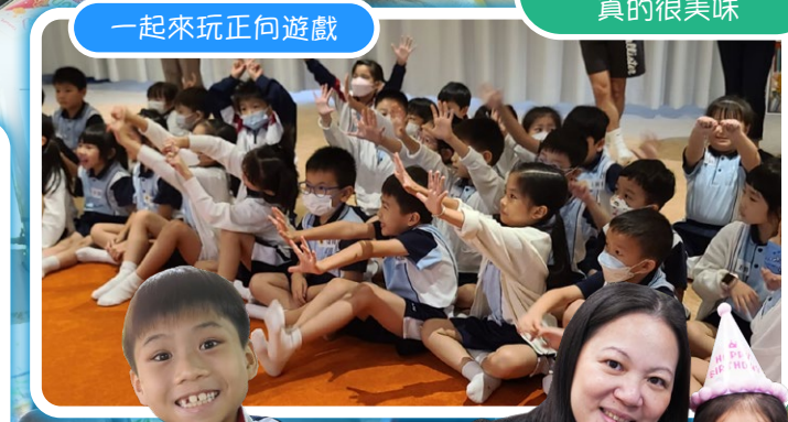
一起來玩正向遊戲