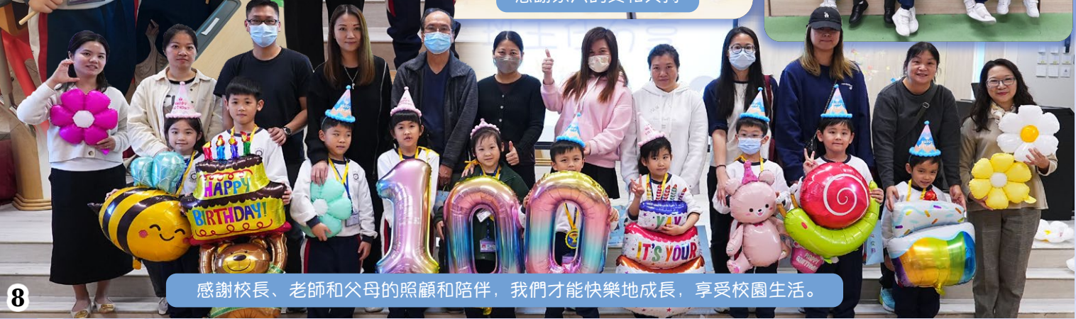
感謝校長、老師和父母的照顧和陪伴，我們才能快樂地成長，享受校園生活。