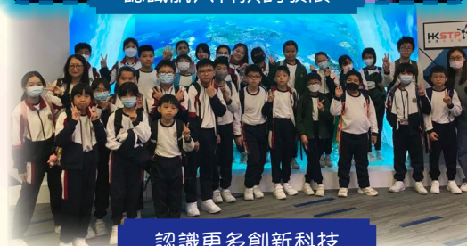
認識更多創新科技