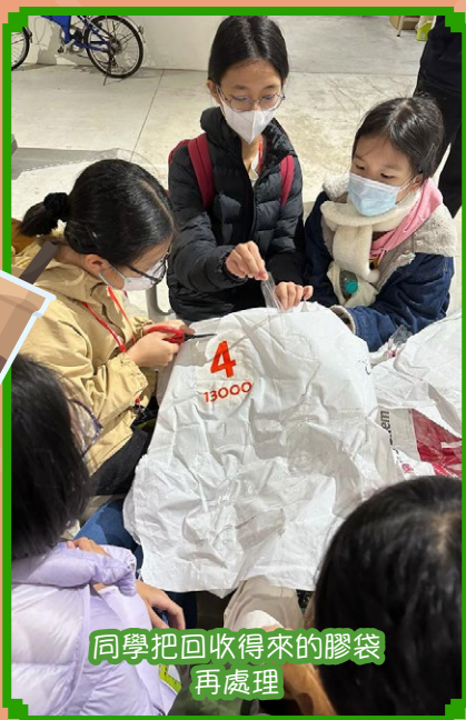
同學把回收得來的膠袋再處理