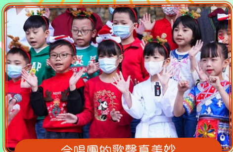
合唱團的歌聲真美妙

本校於 12 月 16 日 (星期六) 舉辦「葵信開放日樂繽紛」，當天於葵盛社區公園舉行學生匯演，並邀請幼稚園學生及家長出席「聖誕親子填色及繪畫比賽」頒獎禮，同時舉行科組展覽及攤位遊戲，亦可以扭氣球，吃美味的爆谷及棉花糖，無論學生或家長都踴躍參與當天的活動，並且換領豐富的禮物，滿載而歸，共度歡樂的聖誕節。