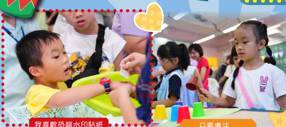
我喜歡恐龍水印貼紙

本校於9月16日(星期六)舉行「葵信開心嘉年華」，當天本校及幼稚園老師準備了有趣的攤位遊戲，為九月開學的家長和學生打打氣，當天人頭湧湧，大家都放下功課，一起參與輕鬆的活動，贏取豐富的禮物，共同迎接愉快的新學年。