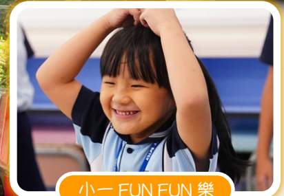
小一 FUN FUN 樂