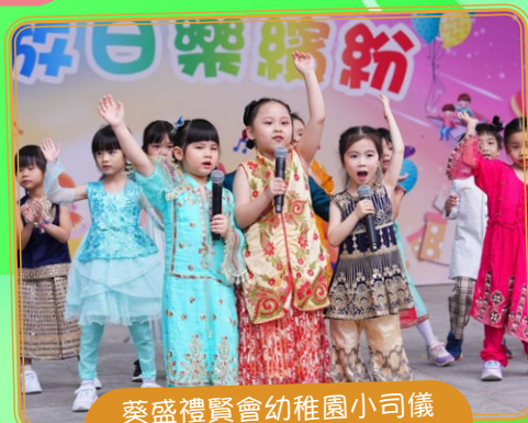
葵盛禮賢會幼稚園小司儀 口才了得，舞姿曼妙！